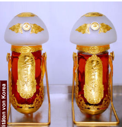
Schnaps aus Kiefernpilz

wendet und enthält Amylvinylkarnol, Zimtsäure und Oktenol.